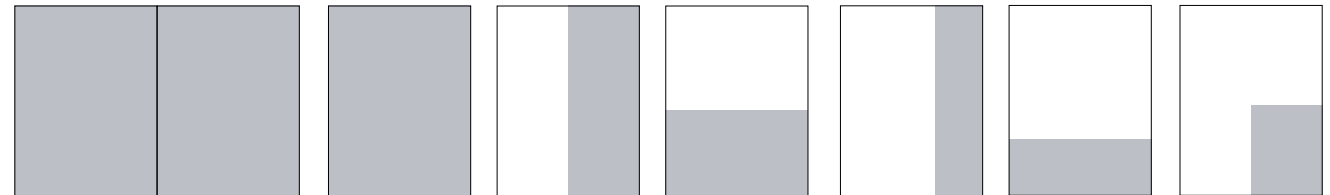
2/1 Seiten A: 400 x 270 mm