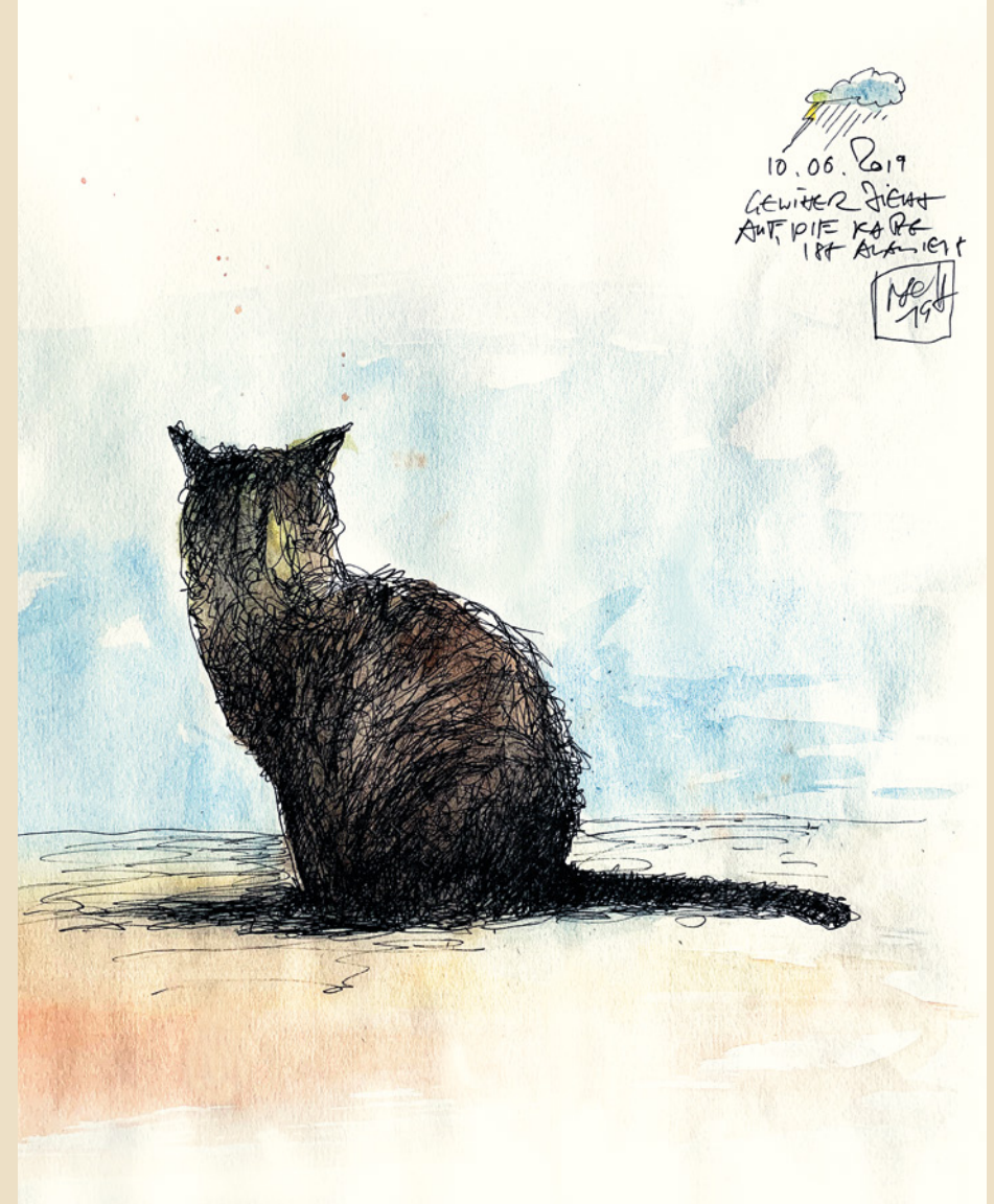
12. „Coco“ 2019

Technik: Tusche / Aquarell auf Papier Format: 29,7 x 42 cm