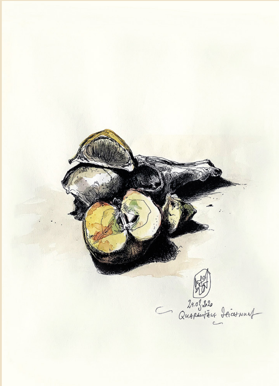
7. „Dekorierter Schädel“ 2020

Technik: Tusche / Aquarell auf Papier Format: 21 x 29,7 cm