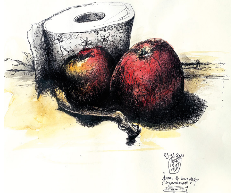
16. „Lockdown II“ 2020