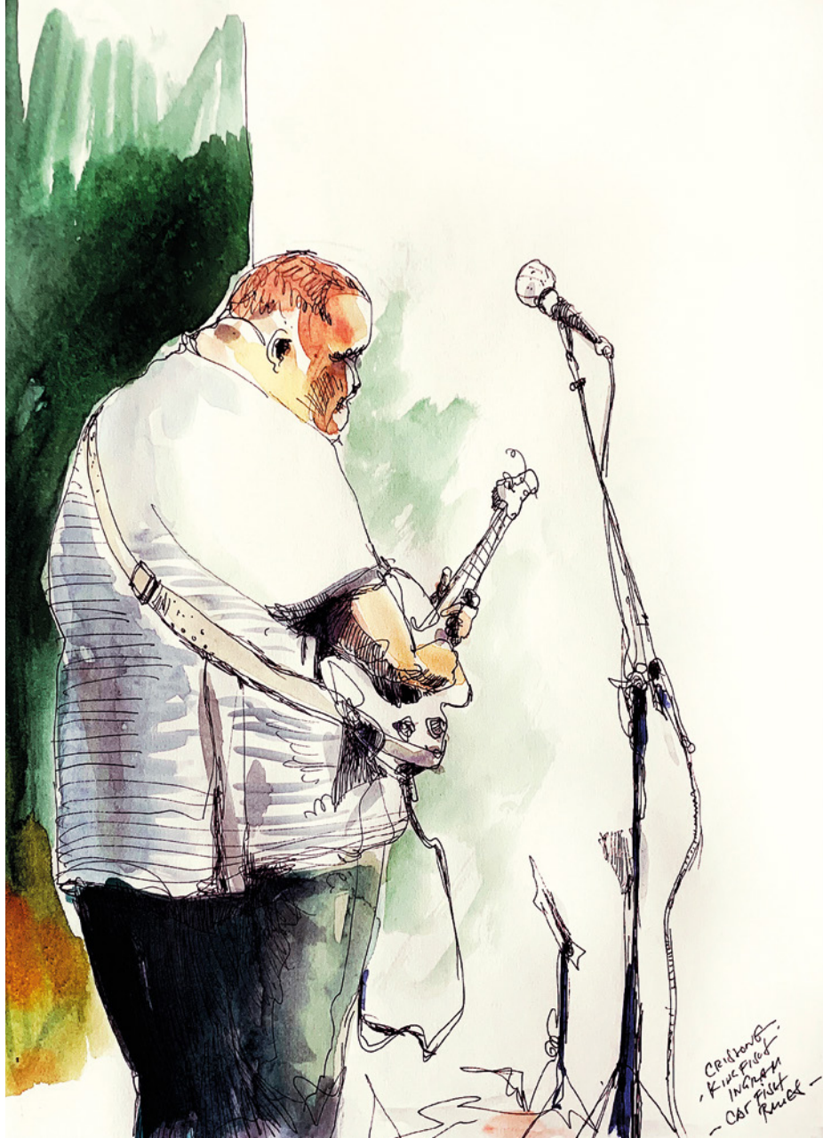
15. „Blue Note“ 2018