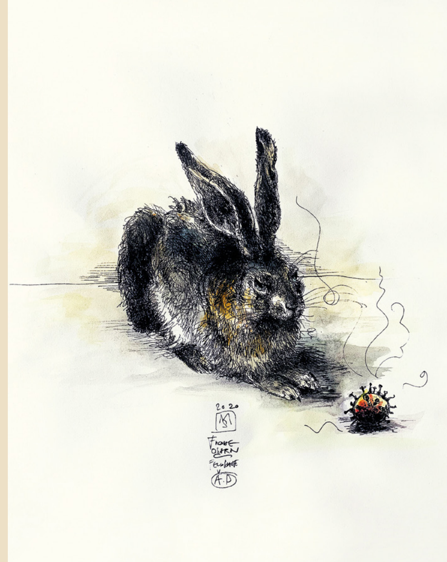
18. „Lockdown III / Ostern“ 2020

Technik: Tusche / Aquarell auf Papier Format: 29,7 x 42 cm