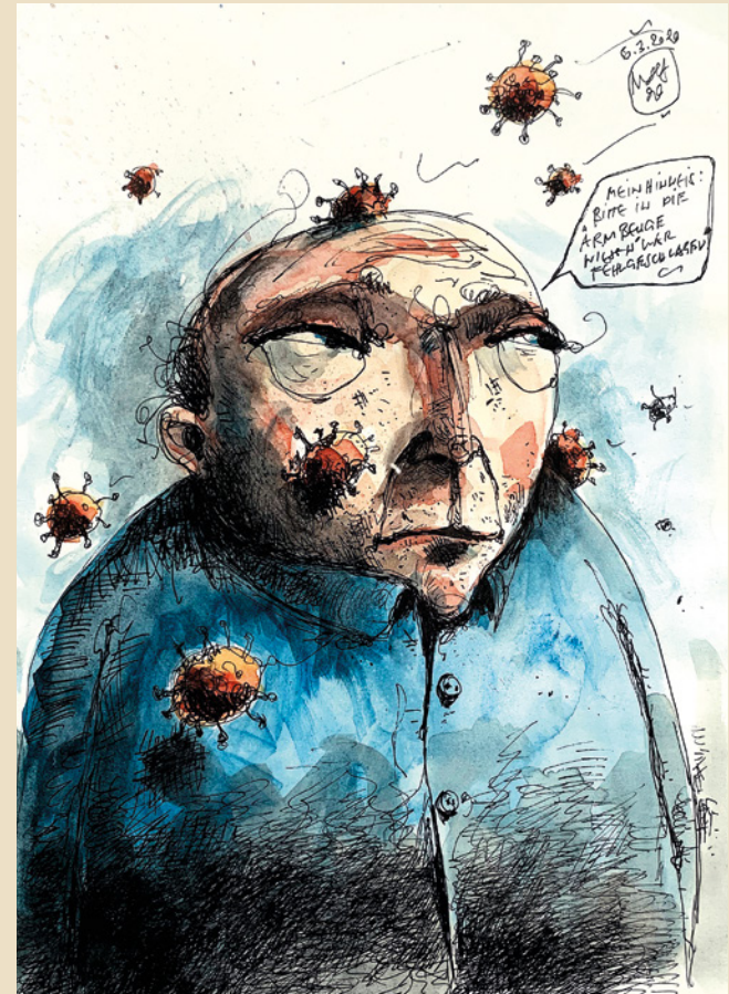
8. „Niesetikette“ 2019

Technik: Tusche / Aquarell auf Papier Format: 21 x 29,7 cm