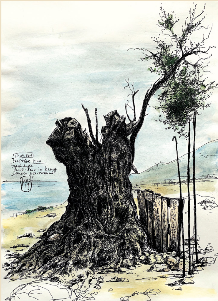
11. „Olivenbaum“ 2019

Technik: Tusche / Aquarell auf Papier Format: 29,7 x 42 cm