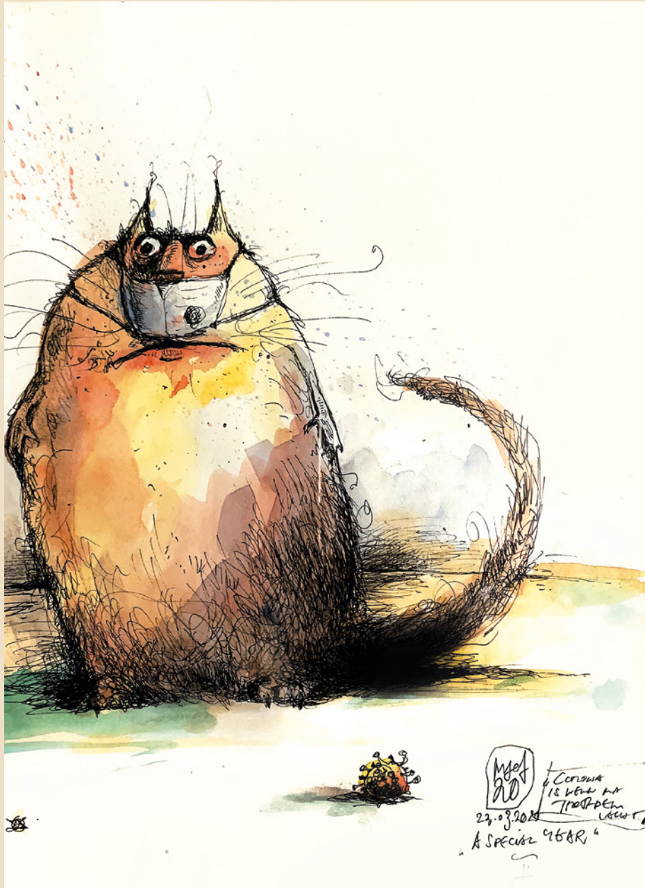
17. „Lockdown VI“ 2020

Technik: Tusche / Aquarell auf Papier Format: 29,7 x 42 cm