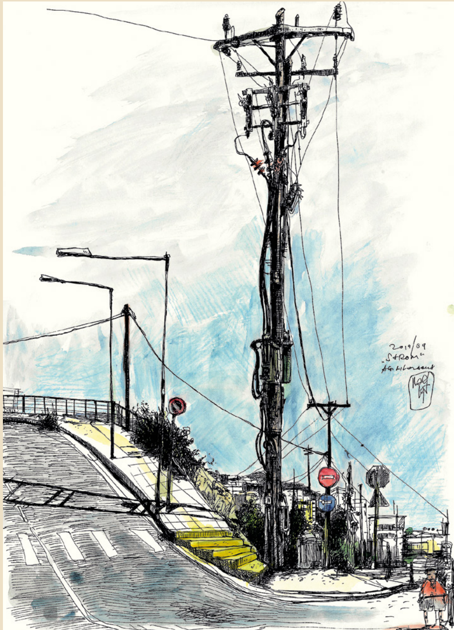
13. „Strom“ 2019 (Crescendo)

Technik: Tusche / Aquarell auf Papier Format: 29,7 x 42 cm