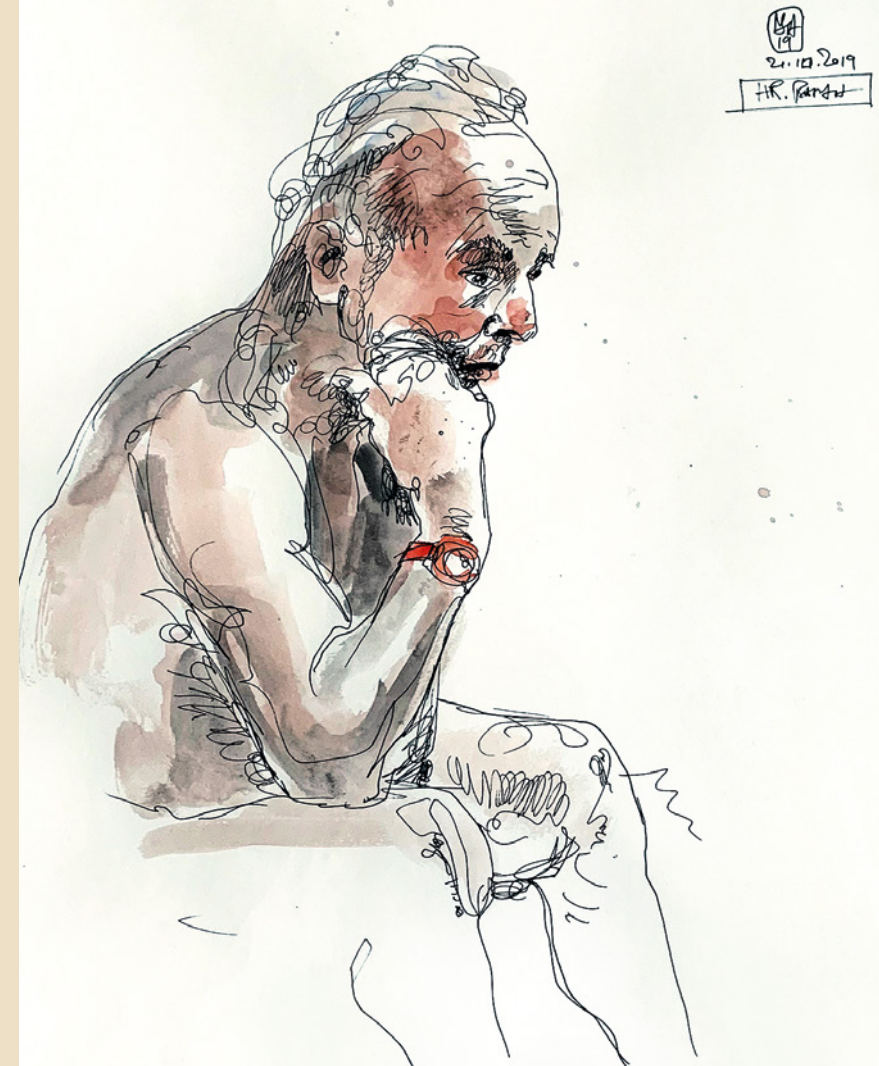
14. „Model Herr B“ 2019

Technik: Tusche / Aquarell auf Papier Format: 29,7 x 42 cm