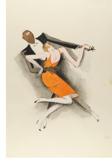
© VG Bild-Kunst, Bonn, 2023 Foto: Museum für Kunst und Gewerbe, Hamburg

halle in Bonn heraufbeschworen. Wir befinden uns in einer vergleichbaren Phase, das ist nicht unbedingt beruhigend, birgt aber unzählige Möglichkeiten. Wie am Beginn der Moderne wird das durch neue Rollenbilder von Mann und Frau befördert. Dazu kam damals eine nie dagewesene Fülle an Kunstströmungen und -zentren, die nicht mehr nur auf das alte Europa und hier vor allem auf Paris beschränkt waren.