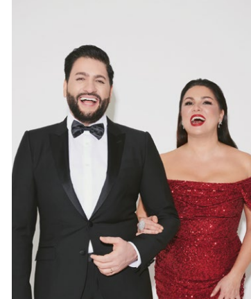
ANNA NETREBKO UND YUSIF EYVAZOV